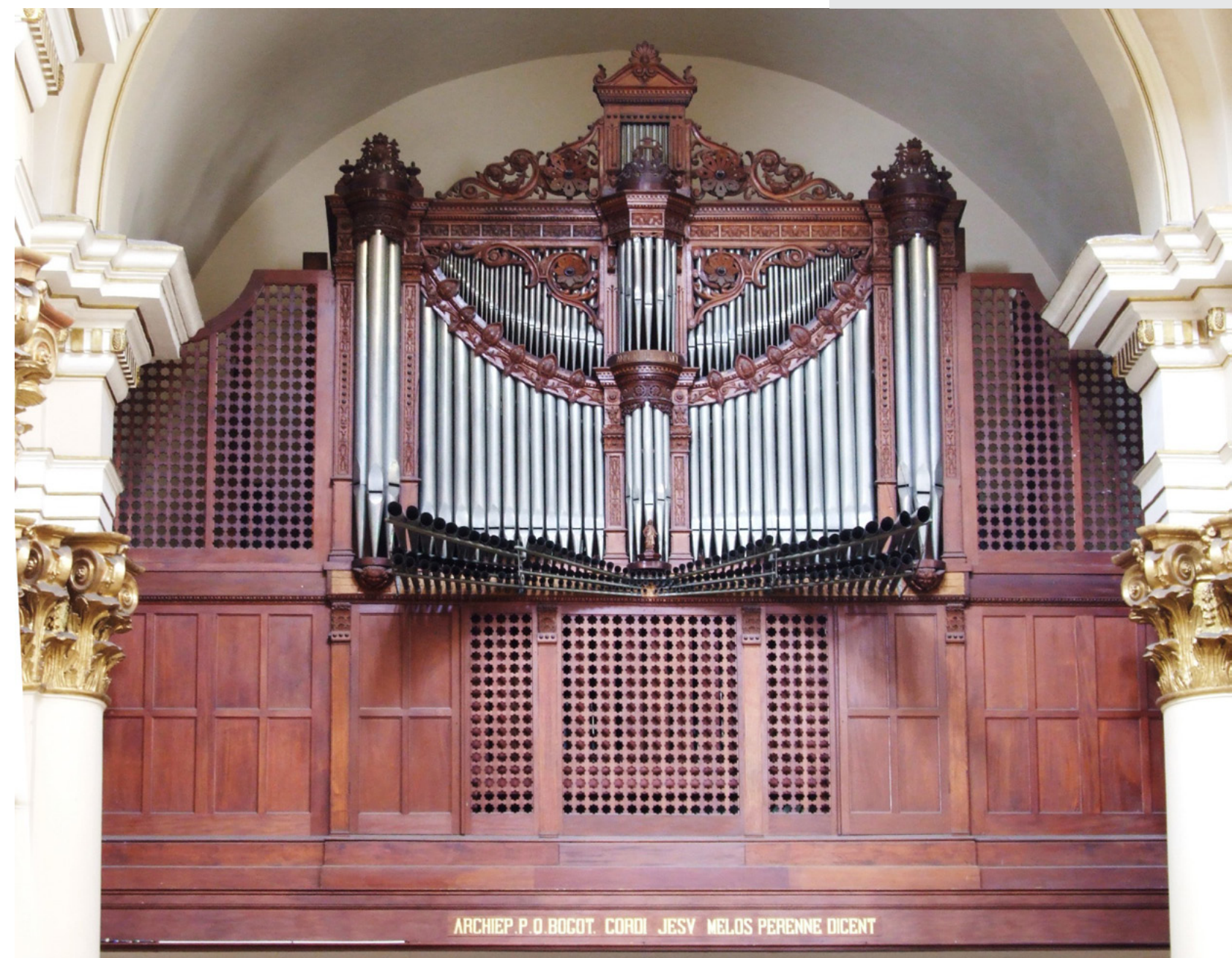
ARCHIEP. P. O. BOCOT. CORDI JESY MELOS PERENNE DICENT

La transmisión de notas y registros es electro neumática. Los secretos, encargados de la distribución del viento a los registros y tubos, son neumáticos y fueron incorporados en la intervención de 1965, dispuestos de la siguiente manera: