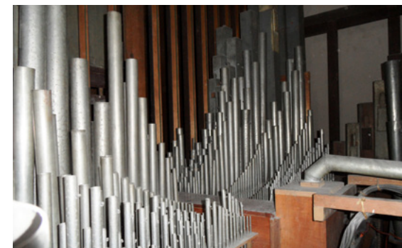
Distribución de los tubos en uno de los niveles del mueble.

60, dado que las características constructivas son muy distintas, es muy fácil su identificación, por lo cual se establece que el núcleo fundamental del órgano corresponde a la tubería del órgano que Aquilino Amezua construyó en Barcelona para la Catedral de Bogotá.