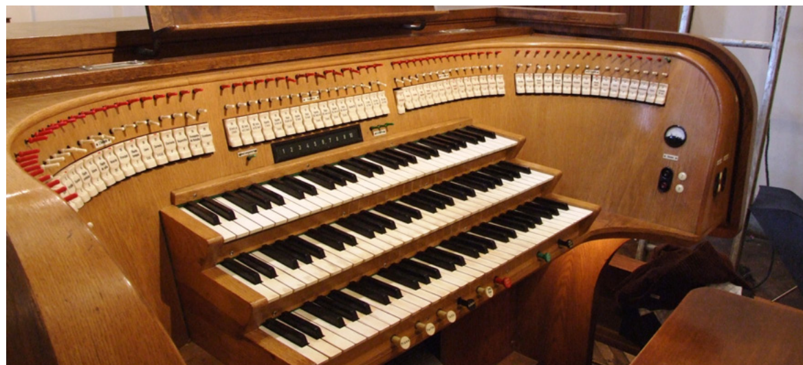
Consola incorporada al órgano en la intervención de 1965 por el organero Oscar Binder.

El paso de los años y la falta de mantenimiento hicieron que el órgano y sus componentes técnicos se deterioraran aunque la sonoridad del órgano se mantuvo en esencia inalterada.