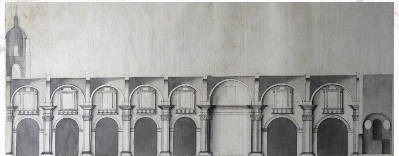
▲ Corte Catedral