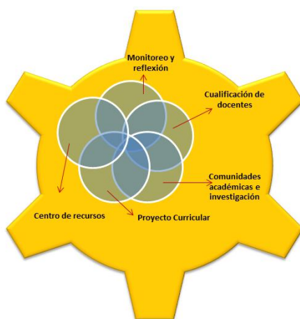
COMPONENTES DE LA DIMENSIÓN PEDAGÓGICA ACADÉMICA

Los cinco componentes que lo conforman son maneras de favorecer, de modo articulado, la formación integral de un ciudadano católico comprometido con su contexto social, a saber: