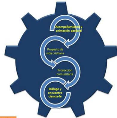
COMPONENTES DE LA DIMENSIÓN EVANGELIZADORA

Dimensión pedagógica académica: Está entendida como el conjunto de principios, criterios y estrategias que orientan y canalizan la formación de excelentes seres humanos, auténticos cristianos y verdaderos servidores de la sociedad.